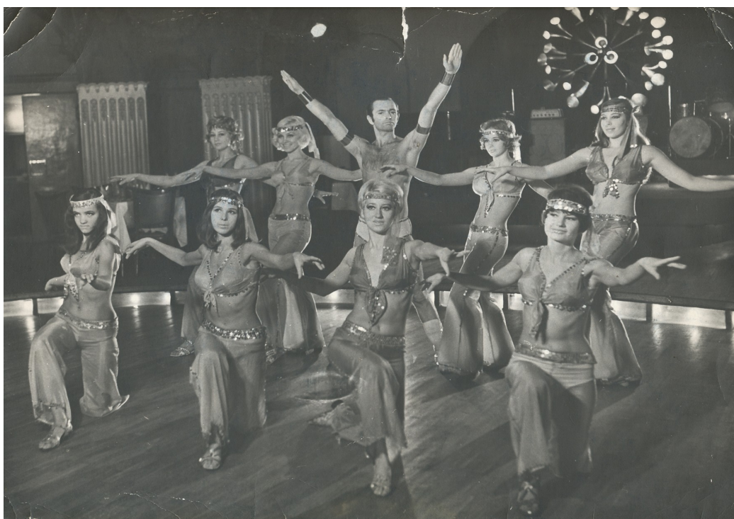
Foto 6. Astoria trupp lavastuses „Hair“ 1970