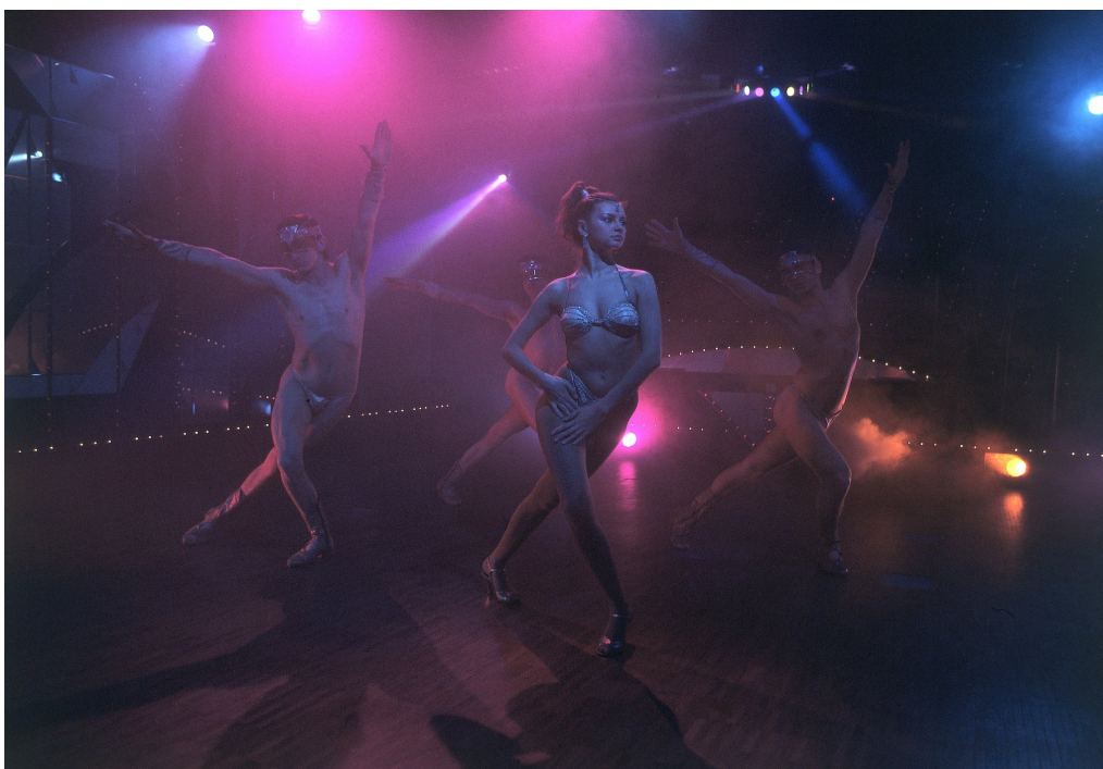
Foto 10. Kalju Saarekese kava „Supernoova“ Viru varietees (Viru varietee)

1994. aasta augustis müüdi oksjonil Viru hotell ning varietee ruumidesse ehitati ööklubi Amigo (ibid.:237).