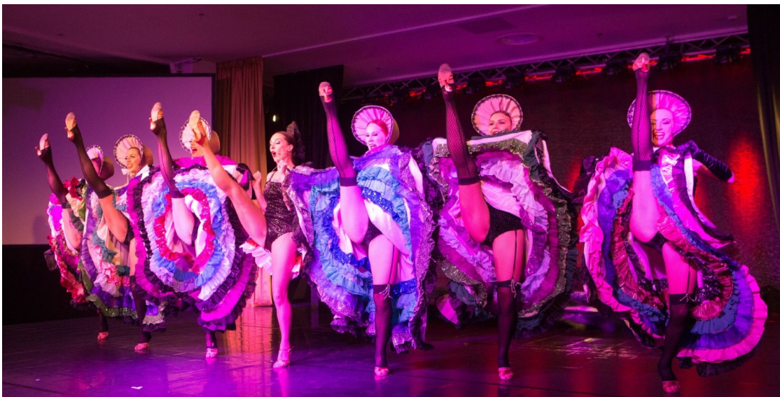
Foto 20. Starlight Cabaret programm „Life is a Cabaret“, 2015 (Starlight Cabaret)