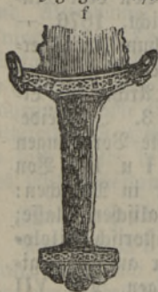
\frac{1}{5} . nat. Größe

von Herrn Carl Graf Sievers 2 verhältnißmäßig gut erhaltene Schwerte aus Gräbern bei der