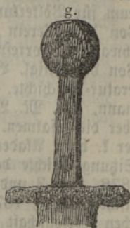
\frac{1}{5} . nat. Größe

Kremonschen Parochialschule, das eine mit verziertem Bronceknopf wie Fig. f, lang 102 cm., das andere mit Eisengriff wie Fig. g., lang 105 cm. Die dabei gefundenen Bronce- und Eisensachen, Topfscherben u. dgl. befanden sich unter den früher eingesand-